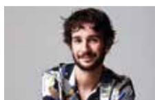
F. Mallet / DR