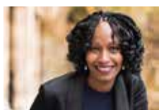
M. Traoré / A. di Crollanza