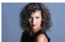
F. Taouzari / Actuel Studio