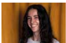
T. Merakchi / DR