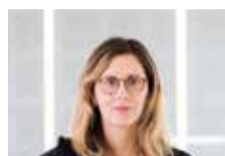
F. Pagneux / T. Louapre