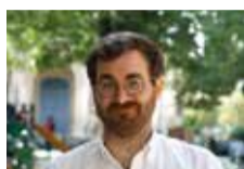
J. Vitores / T. Kleber