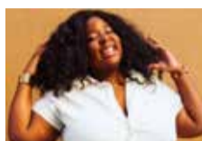
Kiyémis / DR