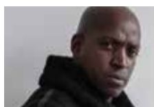
Y. Atonga / E. Marchadour